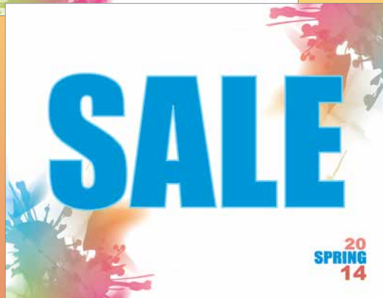
Diseño para los muros de las tiendas Hang Ten México